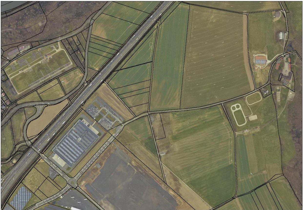
Bereich für eine Erweiterung des Gewerbegebiets „Sandershäuser Berg“