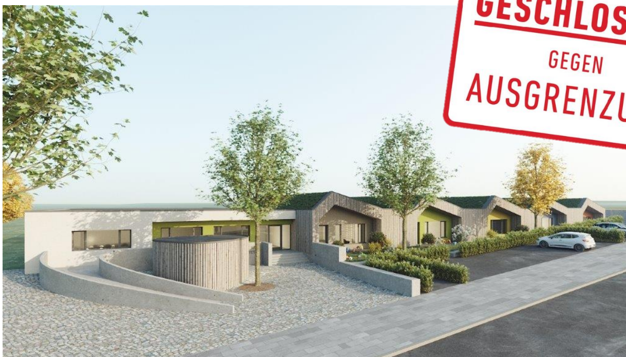
geplanter Kindergarten am Wolfsgraben